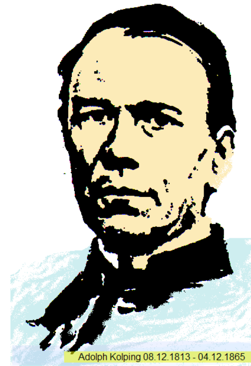
Adolph Kolping 08.12.1813 - 04.12.1865

Das Werk des Menschen kann nicht anders ausfallen als nach dem Geiste, in dem es gewirkt worden. Denn der Geist kann nur seinesgleichen fortzeugen und schaffen. (Adolph Kolping)